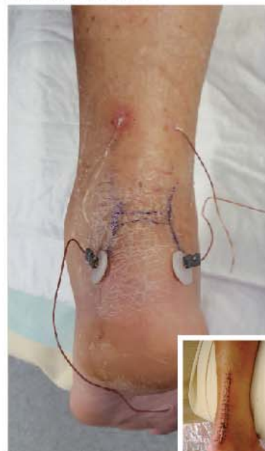
chirurgie percutanée réalisée par le Dr ZAYNI

Pour tout renseignement : 03 83 76 13 13